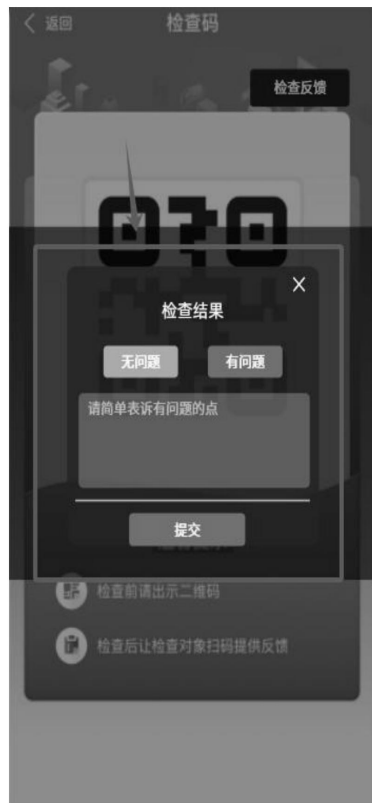
(检查结果反馈页面)